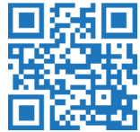
Audio-Guide für Kinder

Der Naturpark Schwarzwald Mitte/Nord, einer der größten Naturparke in Deutschland, ist ein Paradies für alle, die den Schwarzwald aktiv und naturverträglich erleben möchten.